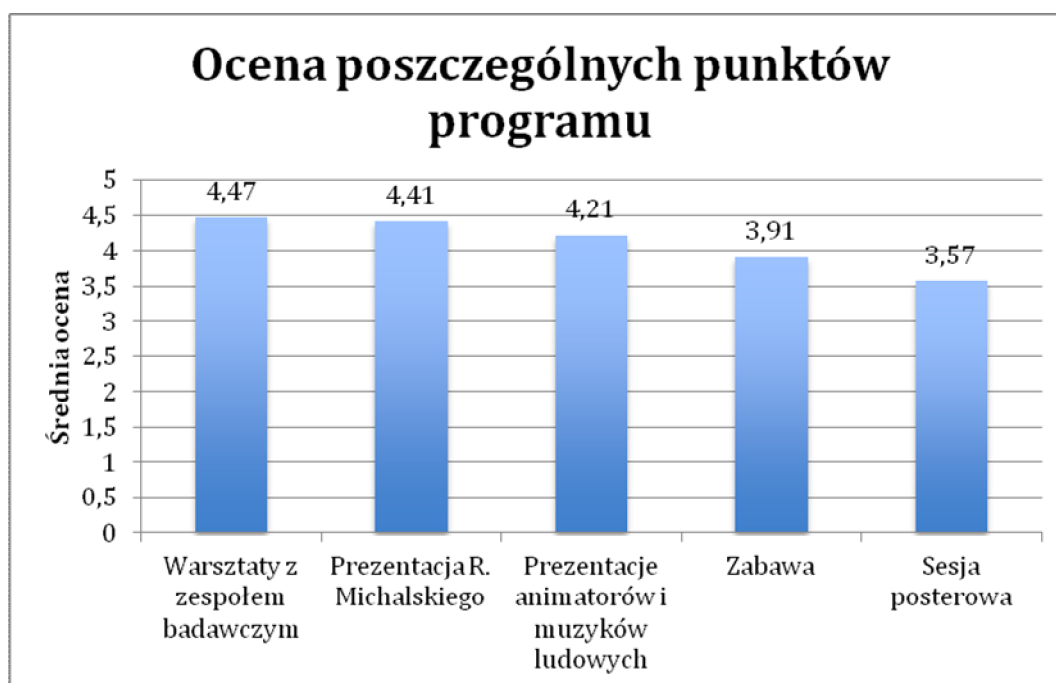
Wykres 3. Ocena poszczególnych punktów programu Festiwalu Edukacyjnego w skali od 1 do 5 (pod uwagę wzięto tylko opinie osób uczestniczących w danym fragmencie Festiwalu).

Noty te nie budzą zdziwienia, jeśli weźmiemy pod uwagę opisane wcześniej oczekiwanie związane z wymianą doświadczeń i rozmowy o kontynuacji programu. Nieco niższą średnią – 4,21 – uzyskały prezentacje projektów animatorów i muzyków ludowych z różnych regionów Polski. W tym przypadku jednak respondenci wykorzystali pełną skalę ocen, od 1 do 5, co wskazuje, że ten element programu wzbudził skrajnie różne emocje. Podobnie stało się w przypadku ocen zabawy przy muzyce ludowej – tutaj średnia z bardzo skrajnych ocen wyniosła 3,91, ale trzeba zaznaczyć, że tę część Festiwalu oceniało już niewiele osób (N=12). Najniższe oceny otrzymał jednak blok programu związany z sesją posterową – 3,57. Słabsze noty można tłumaczyć przede wszystkim brakiem należytego czasu (temu punktowi programu poświęcono zaledwie około 15 minut) i przestrzeni potrzebnej do tego, by móc pokazać główne założenia i rezultaty swojego projektu. Choć część realizatorów nie przygotowała plakatu, ci, którzy w swój poster włożyli sporo wysiłku, mogli poczuć się zawiedzeni.