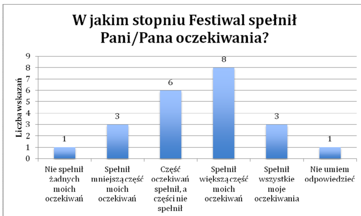
Wykres 2. Ocena Festiwalu Edukacyjnego (N=22).

Zapytani w ankiecie o to, na ile Festiwal spełnił ich oczekiwania, respondenci bardzo mocno różnili się w swoich opiniach. Choć najczęściej wskazywaną odpowiedzią była ta mówiąca o spełnieniu większości oczekiwań, to jednak spora liczba mniej zadowolonych uczestników spowodowała, że średnia ocena wyniosła 3,42 (por. wykres 2).